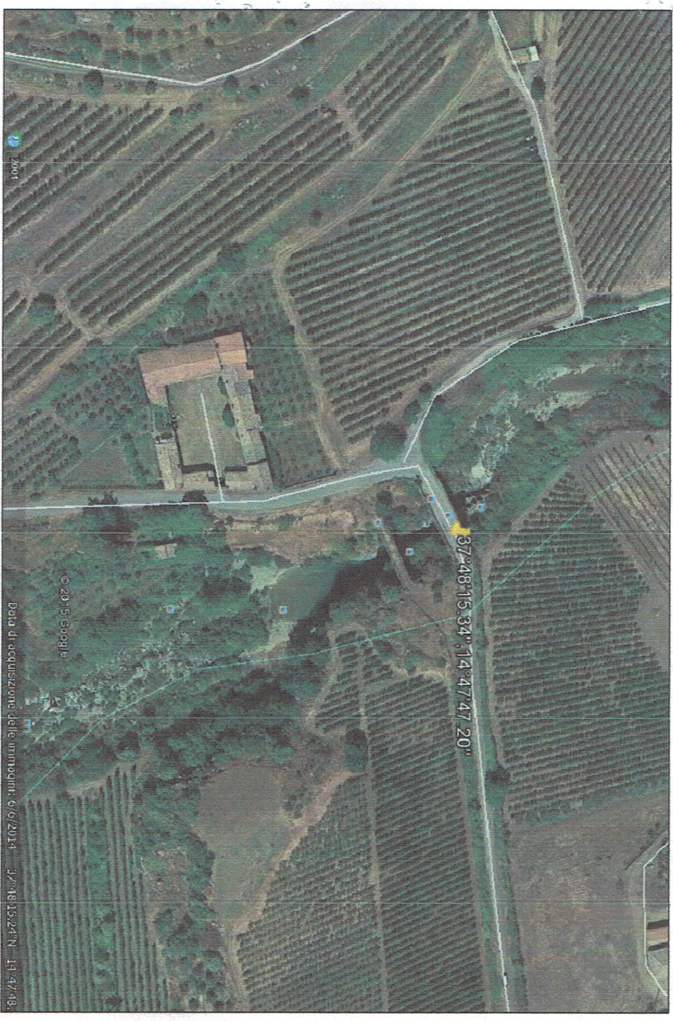
Data di acquisizione delle immagini: 6/6/2014 3°29'18.15241"N - 14°47'47.78"