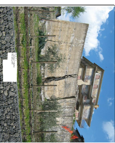
C.DA PIZZO SALICE

Al verificarsi dell'evento il Sindaco attiva il presidio operativo il quale attivera' a sua volta i presidi territoriali ed il volontariato locale. Sarà hiusa la strada comunale con i cancelli,onde evitare la possibilità di transito. PERCORSI ALTERNATIVI:la circolazione veicolare ,all' altezza del cancello dovrà invitataa a procedere con la massima cautela. Quadora il dissesto dovesse minacciare i fabbricati aziendali dovrà ordinare lo sgombero degli stessi.